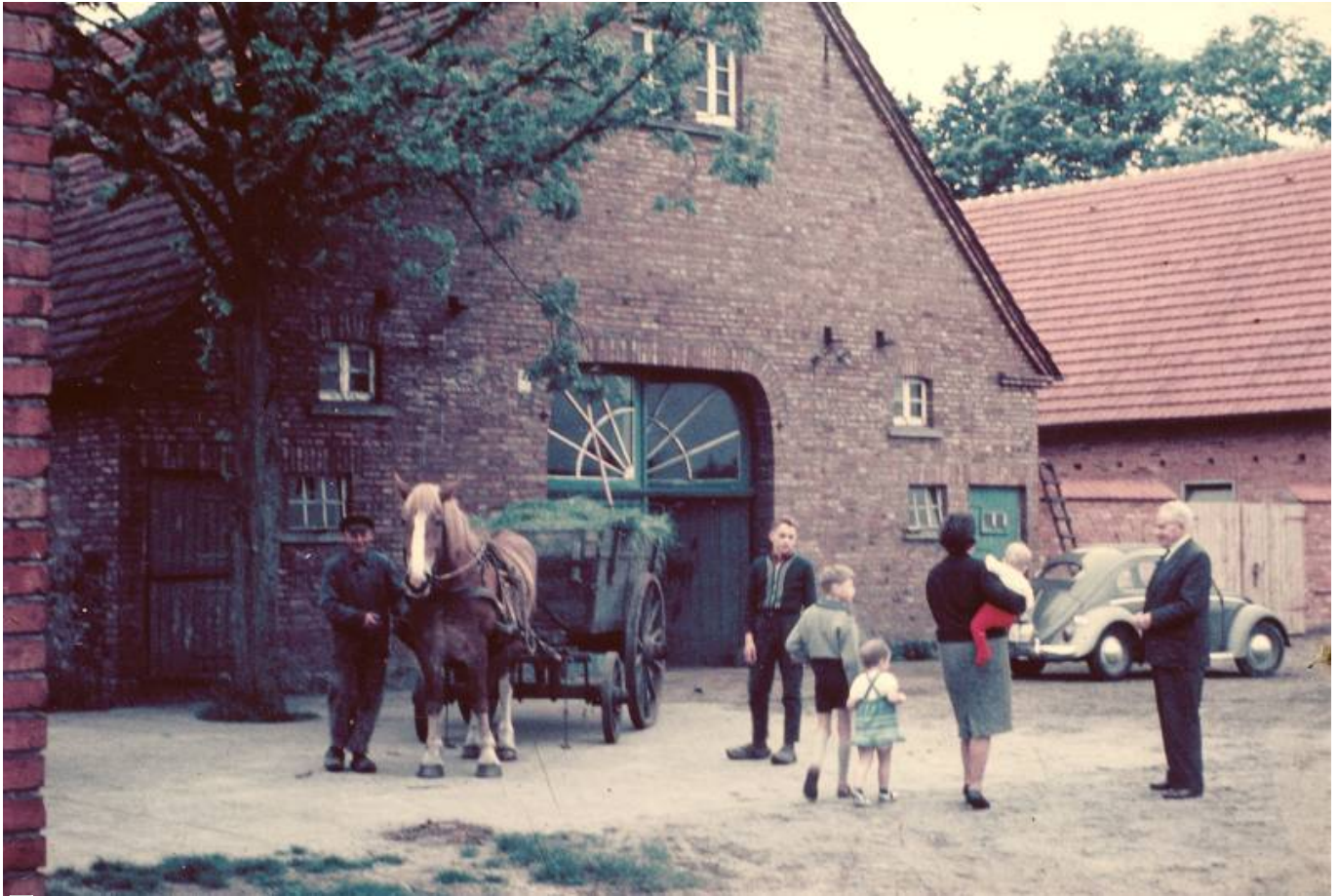
Hofstätte Kampwerth ca. um 1975

Somit war die Sauenhaltung eine Zeitlang das Hauptstandbein des Hofes. Aber auch bei den Kampwerths wird die Landwirtschaft aufgegeben. 2000 kommen die Kühe weg, 2010 die Schweine. Die Ländereien sind jetzt verpachtet.