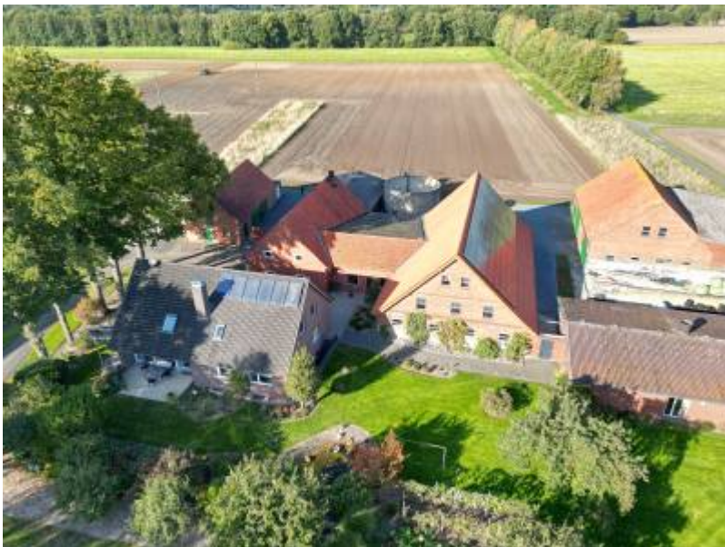
Aktuelle Drohnenaufnahme. Am Ende der nicht gepflügten Ackerfläche hat die alte Hofstätte gestanden